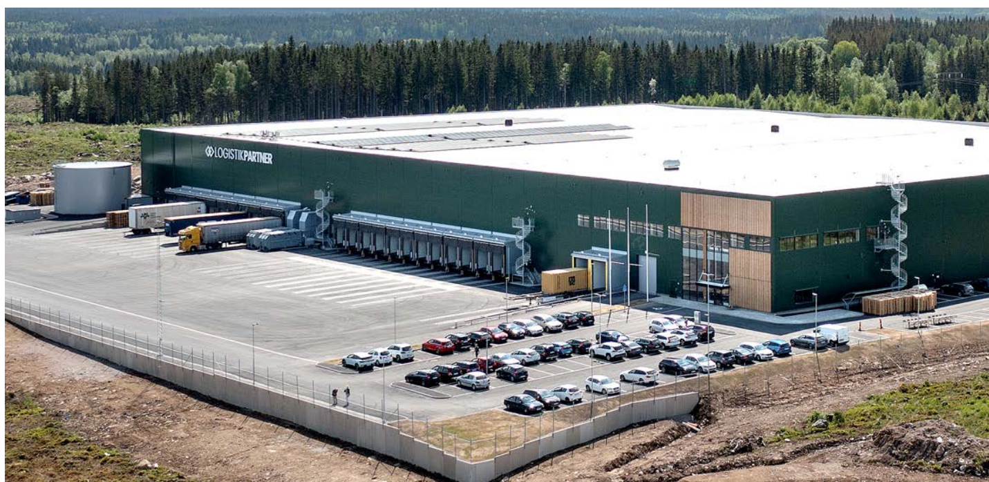
Fastigheten Rönnedal 1 i Ulricehamn.