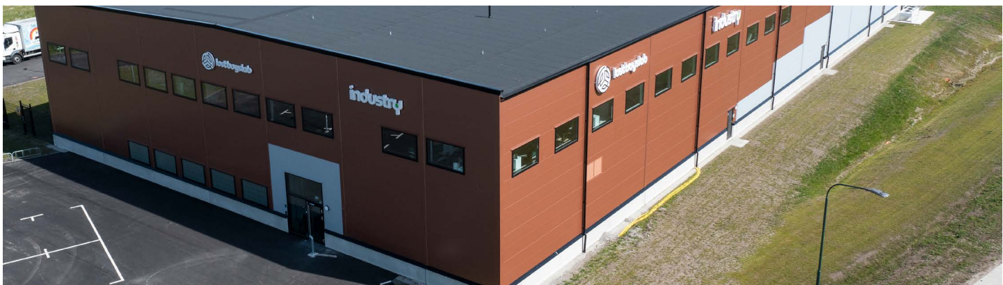
Fastigheten Hoven 1 i Malmö.