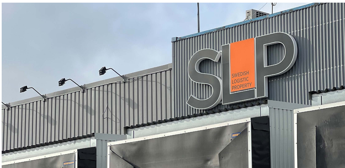
Fastigheten Segeholm 10 i Malmö.

Aktieinnehav i SLP: 250 000 B-aktier samt 257 070 teckningsoptioner vilka berättigar teckning av lika många B-aktier och löper med förfallotid Q2 2026 med strikenivå om 35,2 kr per aktie.